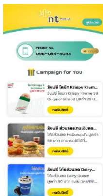
ตัวอย่างหน้าแสดงสิทธิพิเศษ

5. เมื่อเข้าสู่ระบบสำเร็จ จะปรากฏหน้าสิทธิพิเศษ โดยแบ่งเป็น 3 กลุ่ม ซึ่งจะได้รับสิทธิพิเศษไม่เท่ากัน เป็นไปตามเงื่อนไขการใช้ค่าบริการแต่ละเดือน